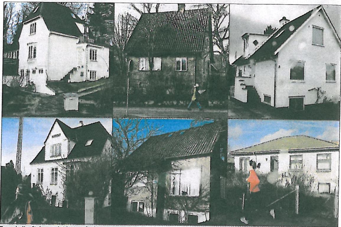
En ny boligaftale gør det lettere for kommunerne at finansiere nye, almene boliger.